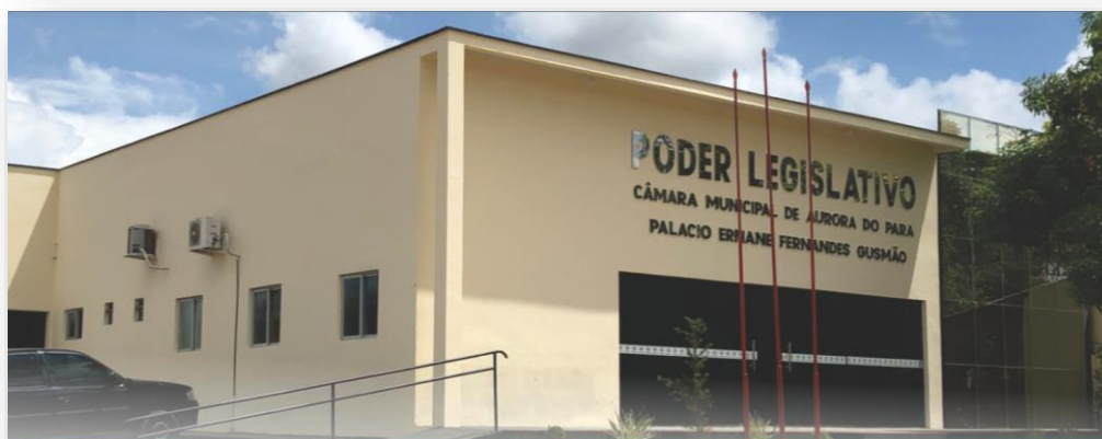
CÂMARA MUNICIPAL DE AURORA DO PARÁ