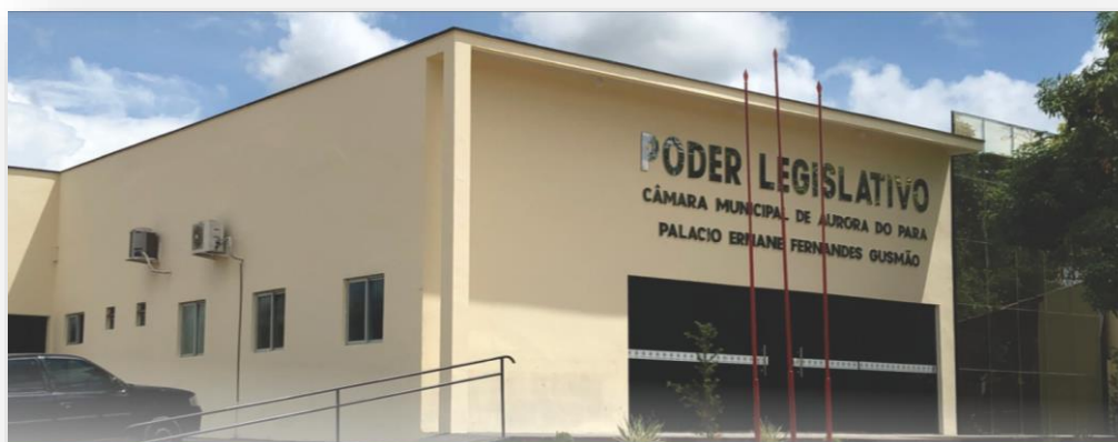
CÂMARA MUNICIPAL DE AURORA DO PARÁ